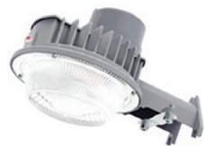
YLD LUMINAIRE SENTINELLE DEL