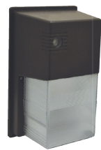
WPA-L GÉN. 2 APPLIQUE MURALE TRADITIONNEL CARRÉ