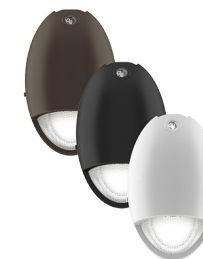
WDP-L DECORATIVE WALL PACK