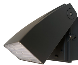
WTL APPLIQUE MURALE À ANGLE AJUSTABLE