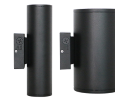
WCY-L CYLINDRES DEL