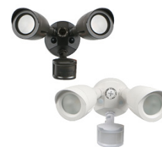
DSL-L GÉN. 2 ÉCLAIRAGE DE SÉCURITÉ DEL