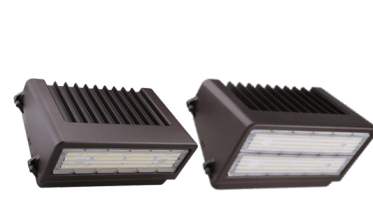
WFC APPLIQUE MURALE FULL « CUTOFF »