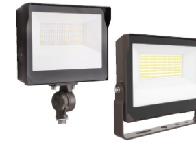
FLM MINI ECO PROJECTEUR EXTÉRIEUR