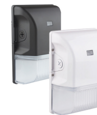
WCI-L GÉN. 2 PETITE APPLIQUE MURALE