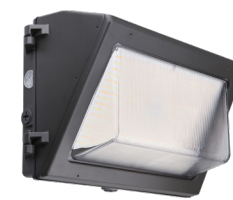
WPS GÉN. 4 APPLIQUE MURALE DEL