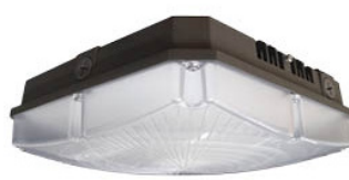
IFO ÉCLAIRAGE DE CORNICHE ET DE GARAGE DEL