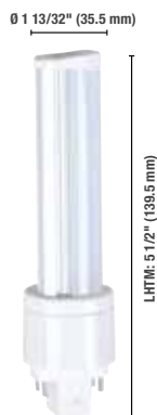
Horizontale 6 W