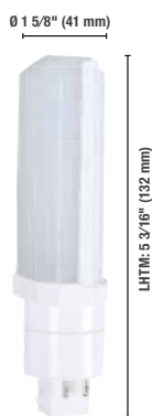
Horizontale 13 W