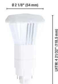
Verticale 13 W