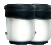
Adaptateur de cuivre