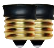
Adaptateur de métal