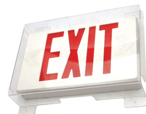
OPTIONS PG - Écran en polycarbonate