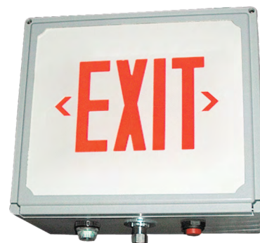
(version avec alimentation propre)

Projet : _____ Type : _____ No de catalogue : _____ Dessiné par : _____ Date : _____